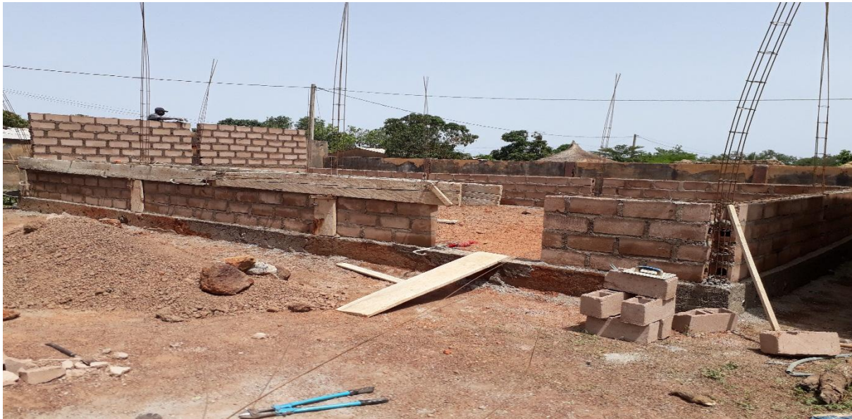
Photo : Chantier de construction de la salle de formation à Keleya

En somme, la gestion du FNACT dans le financement des investissements à Keleya n'a pas été efficace à partir du moment où le projet ne connaît qu'un début d'exécution. Ce retard constitue un manque à gagner pour la collectivité tant sur le plan du fonctionnement que sur celui des ressources financières que pourrait générer le projet au profit de la commune.